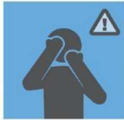
不要用没有洗过的手，或在接触各种表面后，触摸您的眼、鼻、口