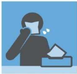
咳嗽或打喷嚏时，用纸巾或衣袖遮住口鼻