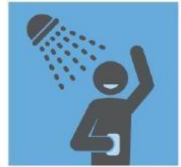
保持良好的卫生习惯