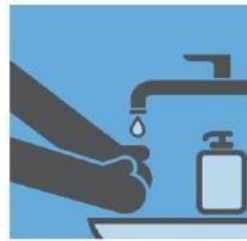
用水和肥皂勤洗手 (至少清洗 20 秒)