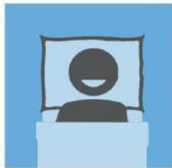
保持充足睡眠并均衡饮食