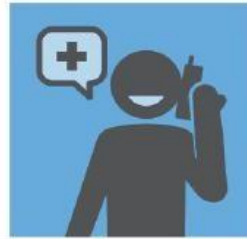
找医生就诊前，先打电话