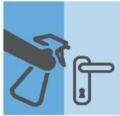
经常对“频繁接触”地方进行清洁和消毒